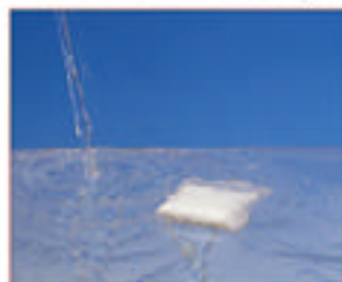
Remplir avec 8 à 10 litres d'eau tiède de préférence.