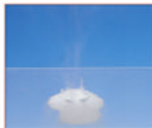
Remuer, la solution est prête à l'emploi.